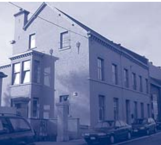
L'espace Relais Famille.