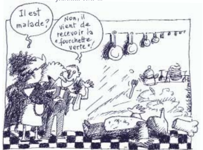
Illustration © Cécile Bertrand

Une Ville-Santé, c'est aussi appuyer des initiatives et des projets locaux. «Le bureau de pilotage remet régulièrement des avis sur la sponsorship de projets visant la promotion de modes de vie sains, l'amélioration de l'environnement de vie, la recherche, la réflexion, l'information des relais... Parmi les initiatives soutenues, nous pouvons citer : les ateliers-cuisines du Centre Public d'Aide Sociale, les projets développés dans le milieu scolaire dont la pièce de théâtre «Votez Louis», la cassette vidéo «Coeur chou-chouté, longue vie assurée», les activités dans les plaines de jeux communales, des journées d'étude comme «Déliation sociale et santé mentale», le projet «fourchette verte»...» 1