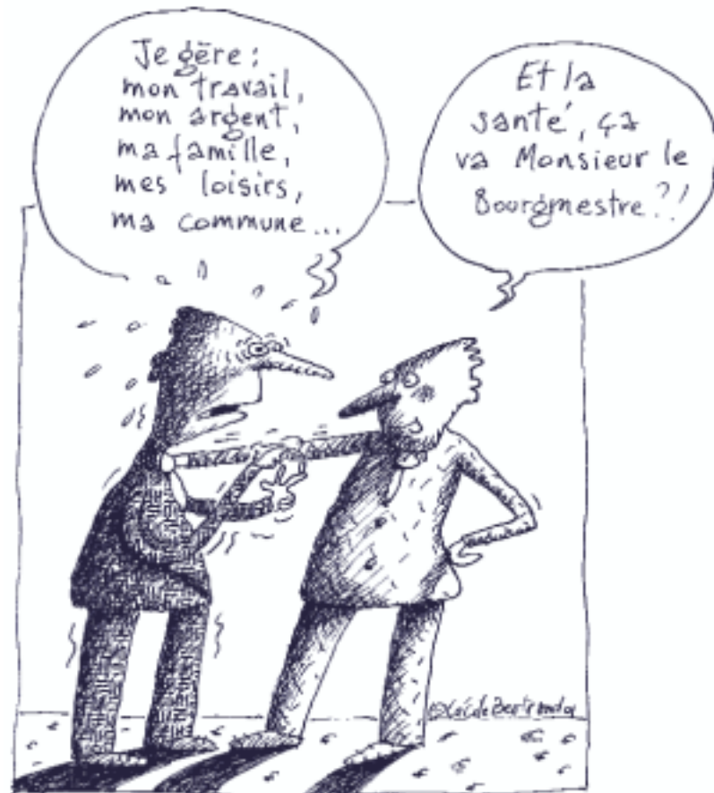
Illustration © Cécile Bertrand

Autres freins possibles : les aspects institutionnels (problèmes de territoire, rivalités, peur de perdre sa spécificité, son autonomie...) ou plus